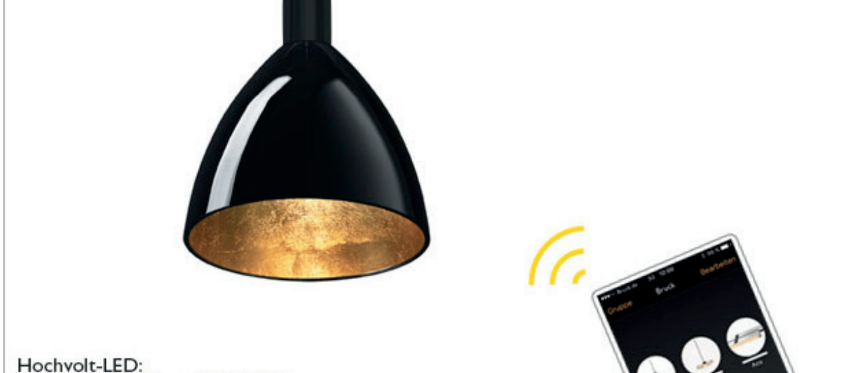
Hochvolt-LED: Silva Neo I60 Down LED AC S