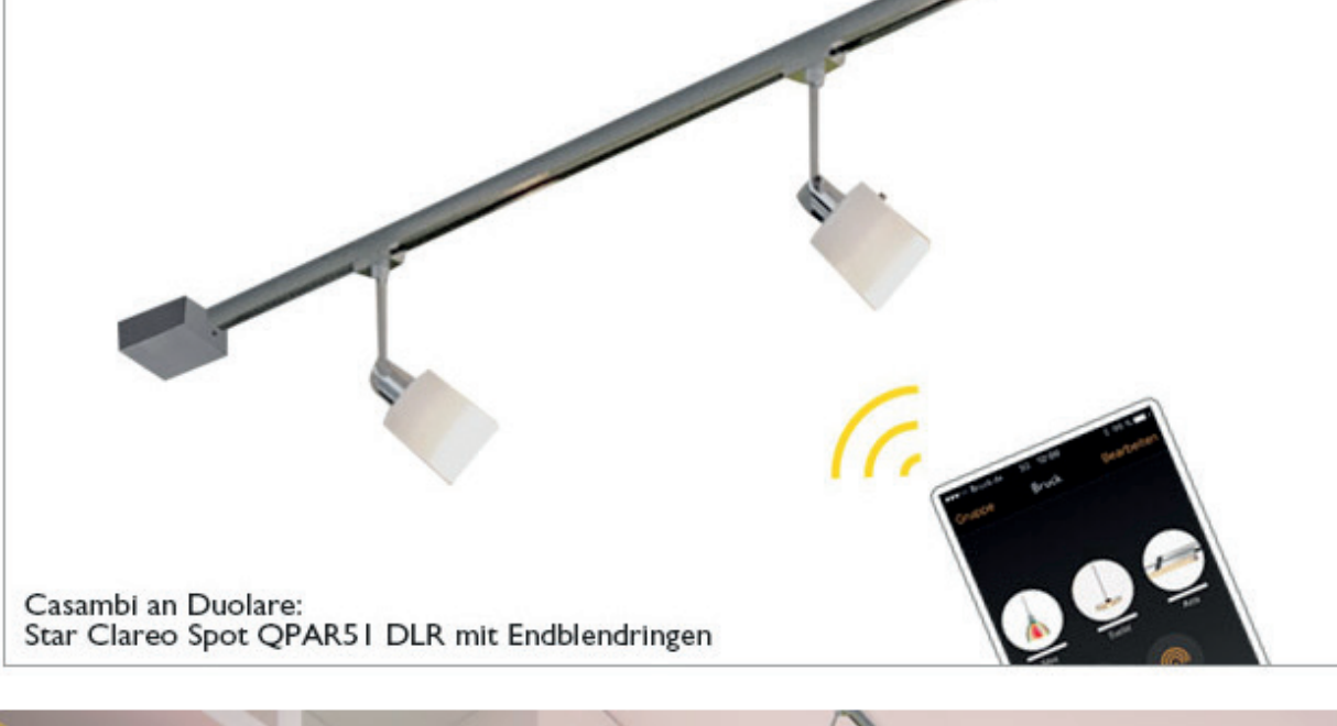
Casambi an Duolare: Star Clareo Spot QPAR5I DLR mit Endblenden