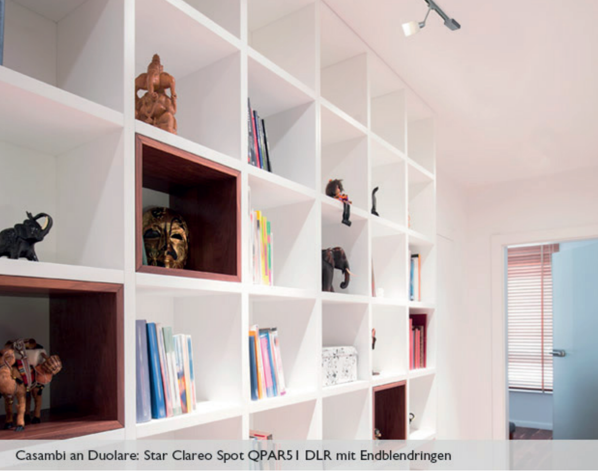
Casambi an Duolare: Star Clareo Spot QPAR5I DLR mit Endblenden