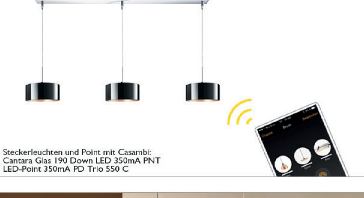
Steckerleuchten und Point mit Casambi: Cantara Glas 190 Down LED 350mA PNT LED-Point 350mA PD Trio 550 C