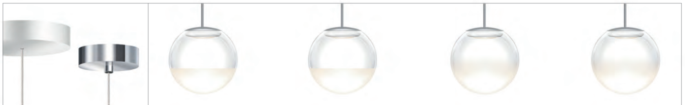
BLOP MOLL AC S