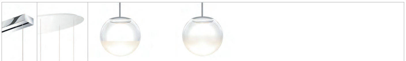
BLOP MOLL LV OE