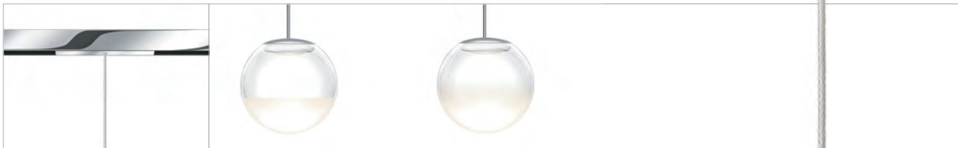
BLOP MOLL ALL-IN