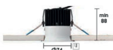
ALPHA DOWN RD 30°