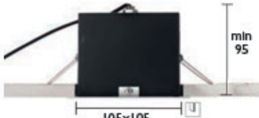
ALPHA SPOT SQ 30°