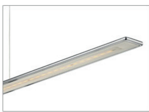
PENDELLEUCHE HORIZON 1200 PD