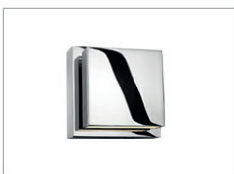
WANDLEUCHE SCOBO DOWN LED PD W