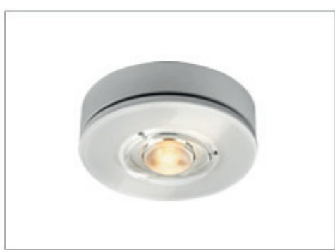
DECKENAUFBAULEUCHE EUCLID PD C