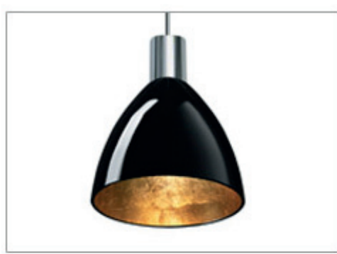
PENDELLEUCHE SILVA NEO DOWN LED 160 PD S

Wir präsentieren Ihnen vier beliebte LED-Leuchten aus unserem breiten LED- und Halogen-Leuchten-Sortiment. Weitere attraktive LED-Leuchten finden Sie auf www.bruck.de .