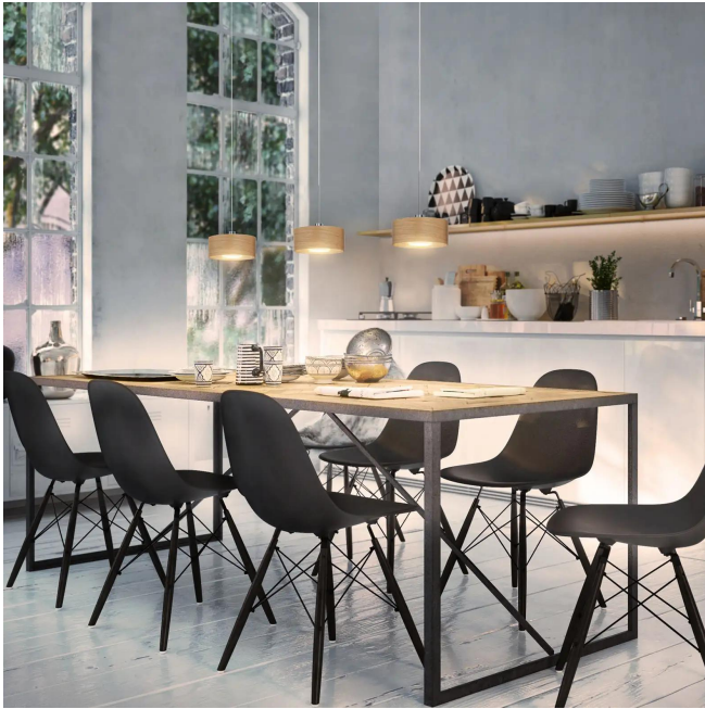
Design BRUCK Werksdesign