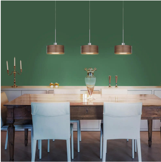
Design BRUCK Werksdesign