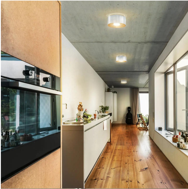
Design BRUCK Werksdesign