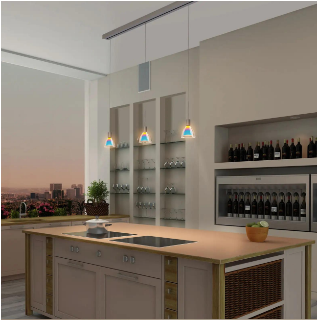
Design BRUCK Werksdesign