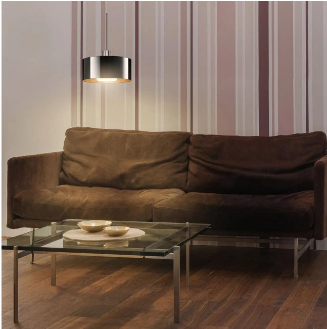
Design BRUCK Werksdesign