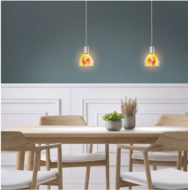
Design BRUCK Werksdesign