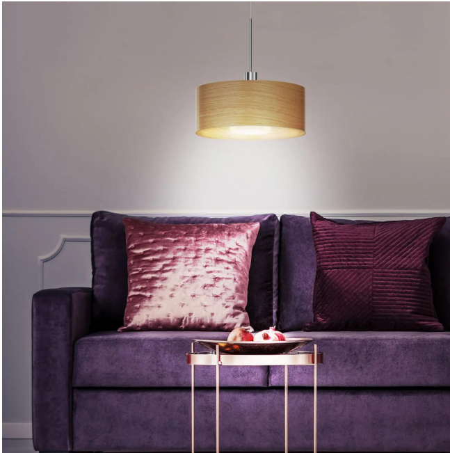
Design BRUCK Werksdesign